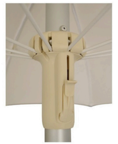
Chiusura Platinum Chiusura Titanium